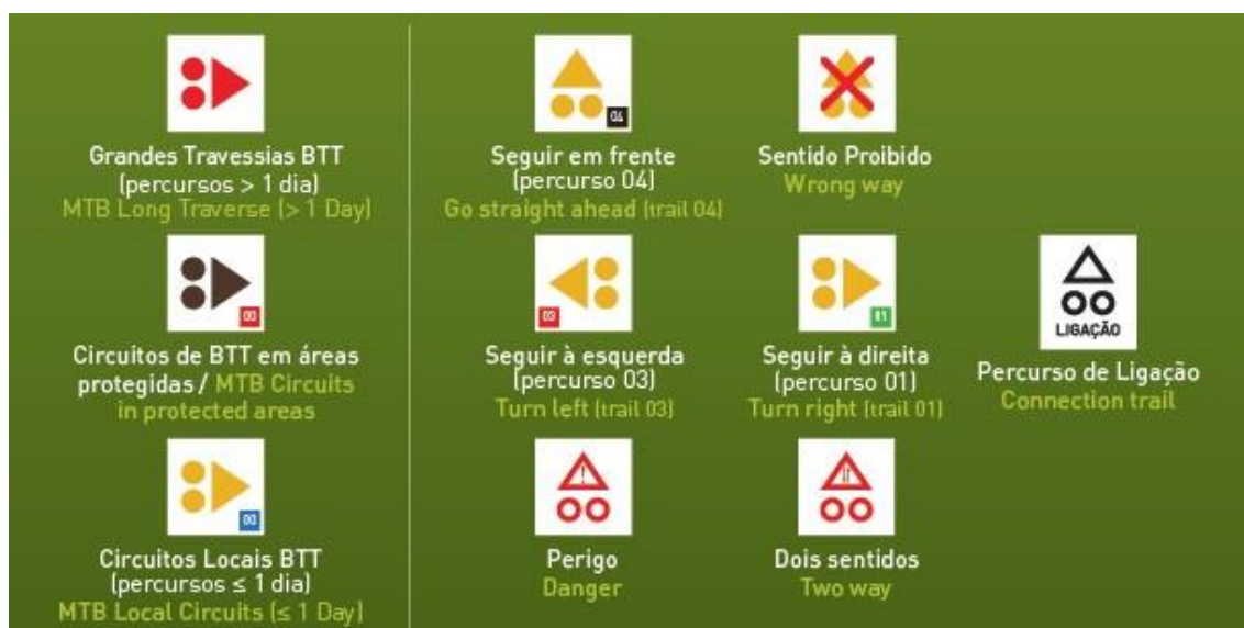
Figura 3 - Sinalética homologada

Homologação: FPC – Federação Portuguesa de Ciclismo