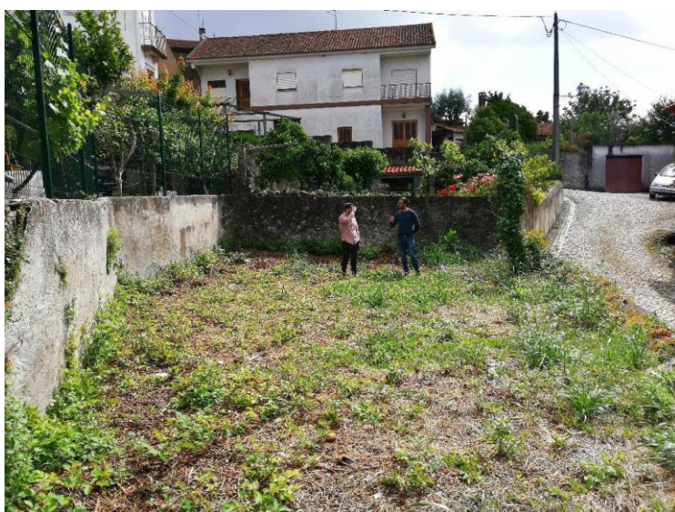
Figura 1 – Espaço sem uso, propriedade da Junta de Freguesia de Abiul

O espaço identificado que seria oportuno para a localização da Estrutura de Animação Permanente seria na zona histórica de Abiul, onde existe um terreno, propriedade da Junta de Freguesia, adquirido com o apoio da Câmara, com as condições ideais.