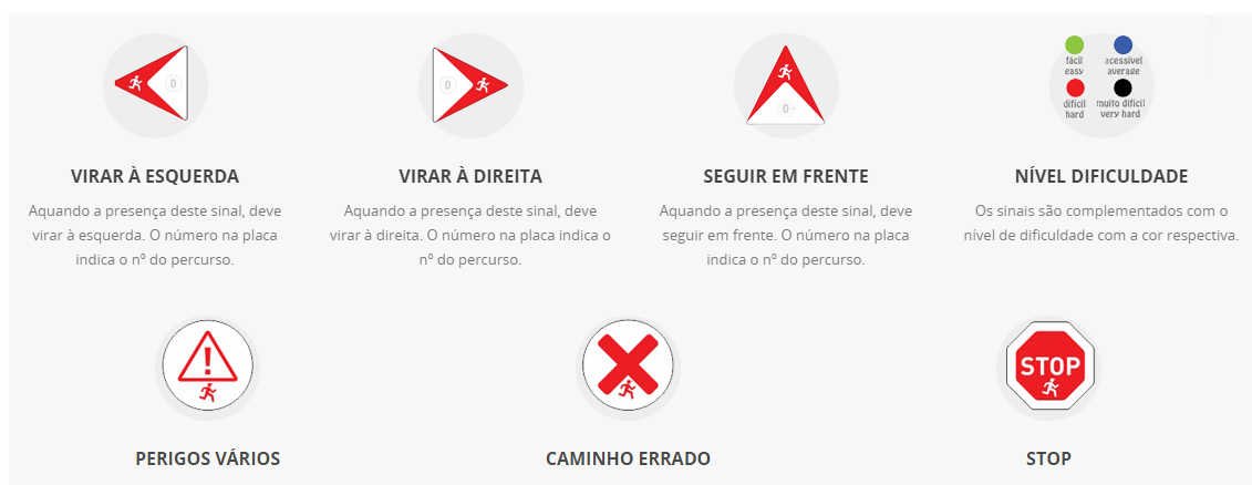
Figura 4- Sinalética aprovada pela ATRP (Associação Trail Running Portugal)

Têm surgido recentemente novos centros de trail running existindo já sinalética específica, garantindo a usabilidade dos trilhos de forma mais segura, durante todo o ano.