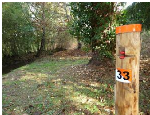
Figura 7 - baliza com alicate de marcação