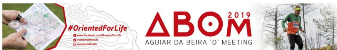
Figura 5 - Projeto de Orientação em Aguiar da Beira, deve ser visto como um bom exemplo